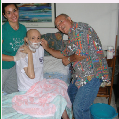
ASSISTENZA ALLA PERSONA