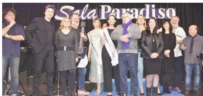
Gli artisti sul palco

Abbiamo, con una certa sorpresa, letto sulla stampa cittadina che nasce a Bologna un certo Progetto Itaca che nulla a che vedere con la fondazione Itaca Onlus che ben da trent'anni opera sul territorio nello stesso settore. Nessuna invidia nè gelosia, penso solo che sarebbe stato più carino e corretto trovare un altro nome.